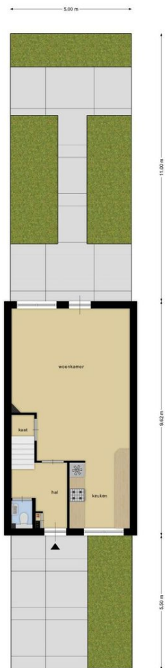
Deze plattegronden zijn opgemaakt voor indicatieve doeleinden. Hieraan kunnen geen rechten worden ontleend.