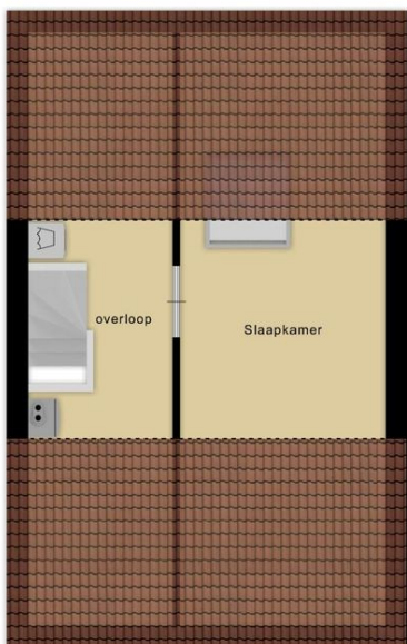
Deze plattegronden zijn opgemaakt voor indicatieve doeleinden. Hieraan kunnen geen rechten worden ontleend.